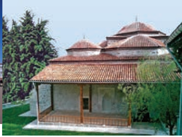
Oğuz Köyü Camii

Mamalı oymağına mensup Sancak Beyliği yapmış Ömer Bey tarafından 1722 yılında yaptırılmıştır.