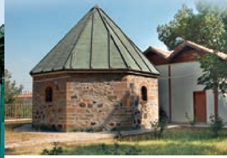
Osmancık Koyunbaba Türbesi

16. yy'ın ilk çeyreğine tarihlenen cami köyün ismiyle anılmaktadır. Cami, dikdörtgene yakın planlı esas mekan ile son cemaat mahallinden oluşmaktadır. Esas mekanın üzeri büyük kubbe, doğu, batı ve kuzeyde yarım kubbe ve iki küçük kubbeyle örtülüdür. Duvarları bir sıra sarı renkli kesme kumaştaşı, bir sıra tuğla örgülü, araları harçlı ve derzlidir. Caminin son cemaat yeri doğu-batı istikametinde caminin kuzeyinde yer almakta olup, ahşap çatı sundurmalı ve alaturka kiremitle örtülüdür. Kuzeybatı köşede tek şerefeli taş ve tuğla örgülü minaresi bulunmaktadır.