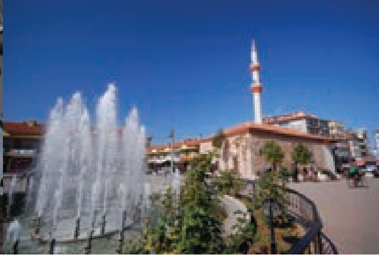
Alaca Eski Camii

İşkilip'in en eski camisidir. Kanuni Sultan Süleyman döneminde şeyhülislamlığa kadar yükselen EBUSS'UD Efendi tarafından, babası Şeyh Yavsi adına 16. yy'ın ortalarında yaptırılmıştır. Cami, EBUSS'UD Efendi'ye ait 1569 tarihli vakfiyeye göre köprü, bedesten, mektep ve handan oluşan külliye'nin bir parçası niteliğindedir. Ancak, bugün külliye'den eser kalmamıştır. Cami ters "T" planlı zaviyeli camilere benzemekte olup güneydoğusunda Şeyh Yavsi'nin türbesi yer almaktadır.