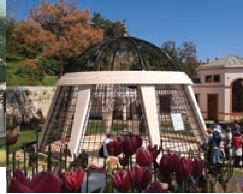
İşkilipli Atif Hoca Ant Mezar ve Külliyesi

Sultan II. Bayezid zamanında 1469 tarihinde yaptırılmıştır. Sekizgen planlı dıştan pramidal çatılı, içten kubbeli türbeye önden iki bölümlü, revaklı bir giriş eklenmiştir. Tepe üzerinde yer alan yapı büyük bahçe içerisinde bir kenara yerleştirilmiştir. Bahçenin iki renkli mermer kapısı üzerinde iki satırlık yazı vardır. Türbenin çift kanatlı, derin oyma tekniği ile işlenmiş ahşap kapısı bugün Çorum Müzesi'nde korunmaktadır.