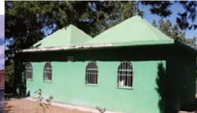
Laçın Ahmet Dede Türbesi

Alaca ilçesine 3 kilometre mesafedeki türbe, 13. yüzyıla tarihlenmektedir. Birbirine geçme iki bölümden oluşan medrese kompleksi içinde yer alan Hüseyingazi Türbesi, Selçuklu mimari özelliklerini taşır. Dikdörtgen planlı, çapraz tonoz örtülü yapının kapısında, 12 köşeli yıldız motifi ile 4 sıra yazılı kitabe görülebilir.