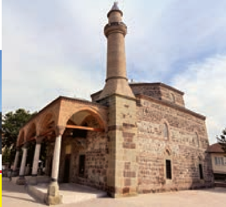
Sungurlu Ulu Camii