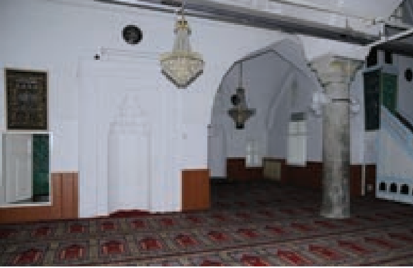
İşkilip Şeyh Muhiddin Yavsi Camii

Bu ezanlar ki şehadetleri dinin temeli Ebedi, yurdumun üstünde benim inlemeli.